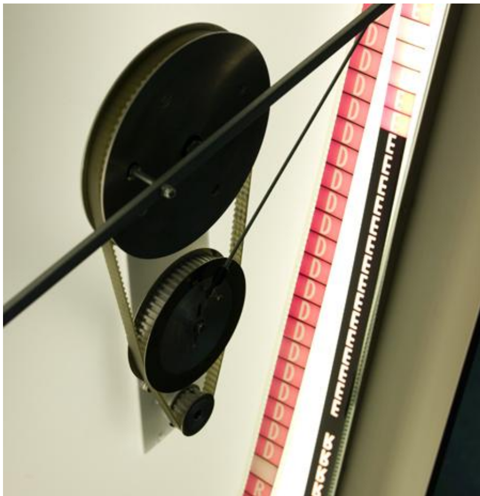
Rosa Barba, time as perspective

Fra gli ospiti più attesi di questa sezione spicca senz'altro l'artista siculo-berlinese Rosa Barba , creativa icona delle arti visive che nella serata di domani, venerdì 15 marzo , introdurrà al Kinemax (dalle ore 21) una corposa selezione dei suoi lavori e delle videoinstallazioni più rappresentative: come "Panzano" (2000, 16'), "They shine" (2007, 4'), "Outwordly from earth's centre" (2007, 24'), "The long road" (2010, 6'10"), "The hidden conference: about the discontinuous history of things we see and don't see" (2010, 11'), "Somnium" (2011, 19'), "Time as perspective" (2012, 12').