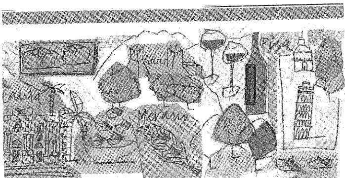
ILLUSTRAZIONE DI JULIA BENFELD